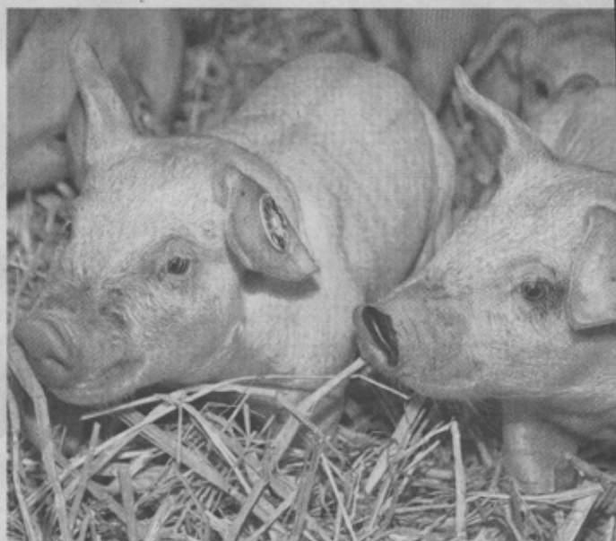
Die Ferkel dürfen im Stroh mit anderen Artgenossen rumtollen.